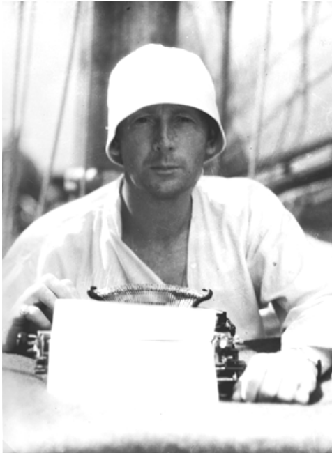
TABU, US 1929 - 1931

Die Sonderausstellung „Friedrich Wilhelm Murnau“ ist chronologisch aufgebaut und in sechs Kapitel gegliedert.