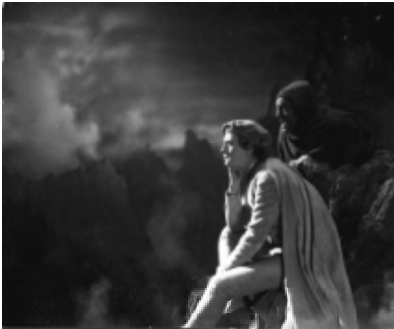
Szenenfoto FAUST, 1925/1926

im Filmmuseum Berlin im Filmhaus 23. Januar bis 4. Mai 2003